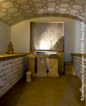
Römermuseum Güglingen