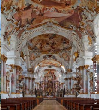
Kloster Zwiefalten