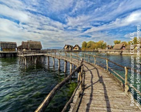
Bodensee Pfahlbaumuseum