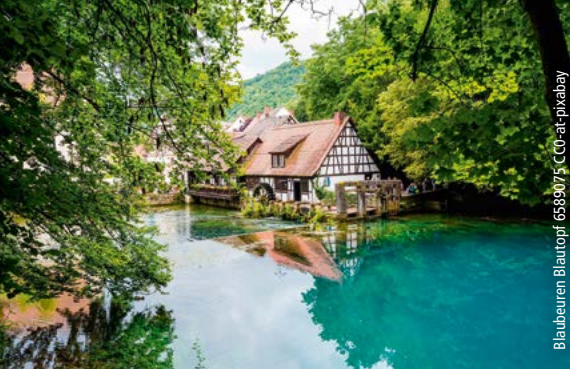
Blaubeuren Blautopf 6589075 CC0-at-pixabay