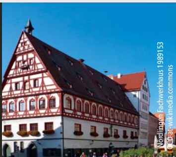
Nördlingen Fachwerkhaus 1989153