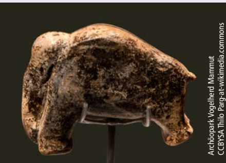
Archäopark Vogelherd Mammut

Die ehemals freie Reichsstadt Nördlingen wird Sie mit ihrer vollständig erhaltenen Stadtmauer und dem mittelalterlichen Stadtbild begeistern. Besonders sehenswert sind die spätgotische Hallenkirche und das Brot- und Tanzhaus .