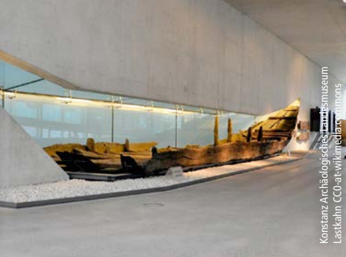
Konstanzer Archäologisches Landesmuseum Lastkahn