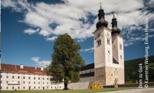
Dom zu Gurk

Freuen Sie sich am Nachmittag auf die hochspannende Keltenwelt Frög! 1882 wurde hier eines der größten Hügelgräberfelder südlich der Alpen entdeckt. Die Ruinen der Grabmonumente, eine Verbrennungsstelle sowie die im Frauengrab gefundenen Originalschmuckstücke lassen Sie tief in den Kult und das Weltbild von vor rund 3000 Jahren eintauchen.