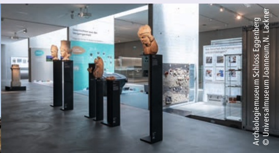
Archäologiemuseum Schloss Eggenberg