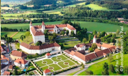
St. Paul im Lavanttal

erwartet werden. Bereits seit 1091 leben, beten und arbeiten hier Benediktinermönche. Die auch heute noch blühende Abtei besitzt eine der umfassendsten privaten Kunstsammlungen Österreichs! Während Ihrer exklusiven Führung außerhalb der regulären Öffnungszeiten erleben Sie die Höhepunkte, die dem Stift das Prädikat „ Schatzhaus Kärntens “ verliehen hat.