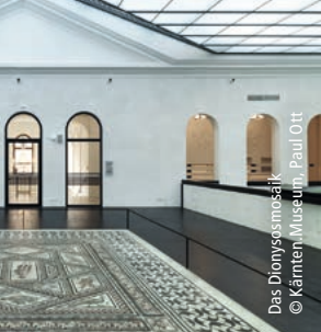
Das Dionysosmosaik