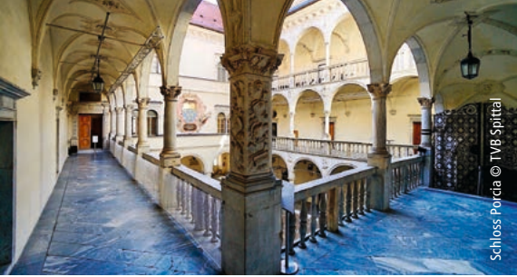
Schloss Porcia