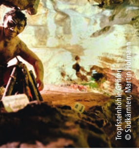
Tropfsteinhöhle Griffen