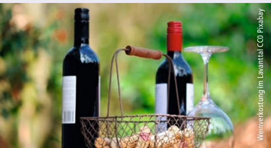
Weinverkostung im Lavanttal

Weiterfahrt ins Lavanttal, wo Sie in dem Benediktinerstift St. Paul