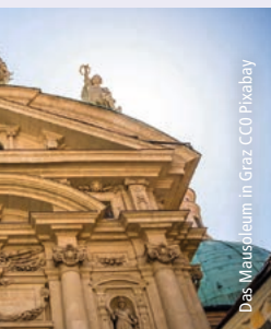
Das Mausoleum in Graz

Fahrt zum Flughafen von Graz und Rückflug nach Düsseldorf.